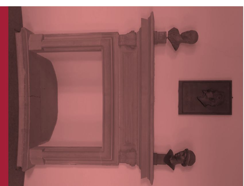
SFB 1391 Andere Ästhetik